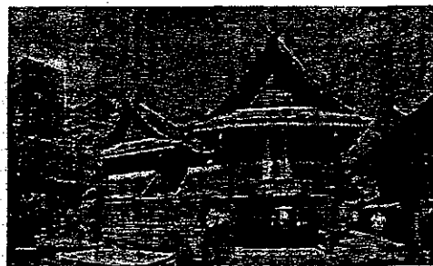
หอศิลป์ลำปาง

17.30 เดินทางกลับถึงมหาวิทยาลัยราชภัฏลำปาง โดยสวัสดิภาพ